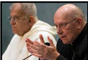
Vaticano aprova normativa especial para acolher anglicanos. O cardeal William Levada (a dir.) e o arcebispo Joseph Augustine Di Noia durante o anúncio no dia 20 de outubro no Vaticano. http://g1.globo.com/Noticias/Mundo/0,,MUL1348257-5602,00.html

“Quando ele desembarcou em 1848, não havia cristãos aqui; quando ele partiu em 1872, não havia pagãos”.