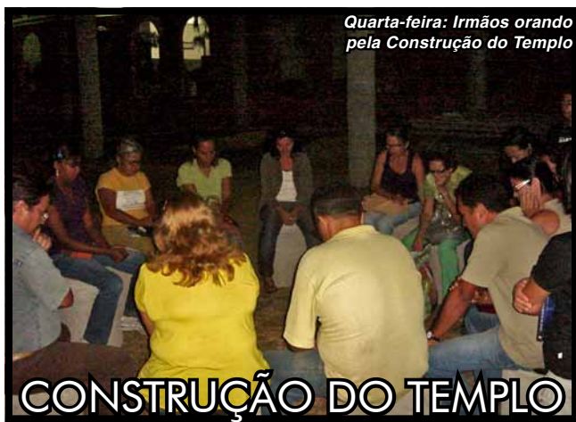
Quarta-feira: Irmãos orando pela Construção do Templo

Lutero e os demais reformadores defenderam alguns princípios básicos que viriam a caracterizar as convicções e práticas protestantes: sola Scriptura, solo Christo, sola gratia, sola fides, soli Deo gloria . Outro princípio aceito por todos foi o do sacerdócio universal dos fiéis .